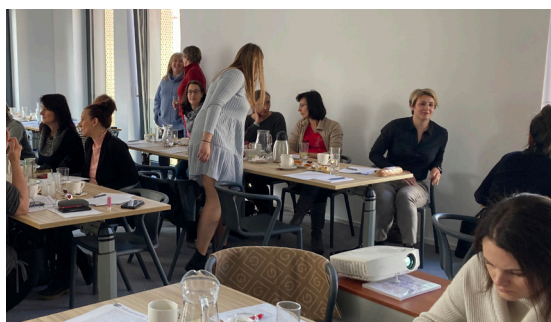
Daň z příjmů 2023 a další změny, DPH 2023